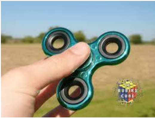
Le Hand spinners