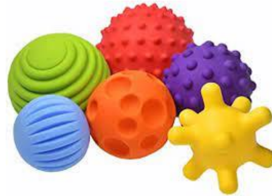
Balles de motricité