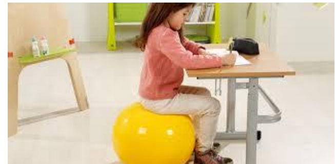
Le ballon d'assise