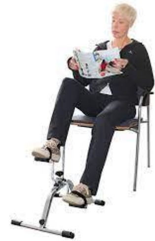
Le pédalier d'exercice