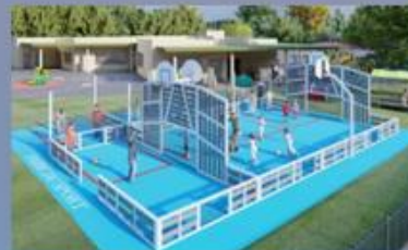
Classe de demain