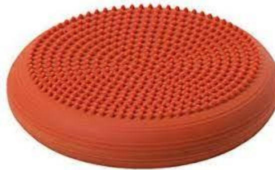
Coussin rond à picots