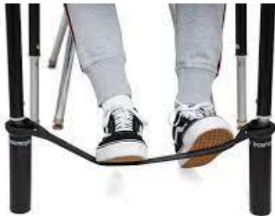
Fidgets pour pieds