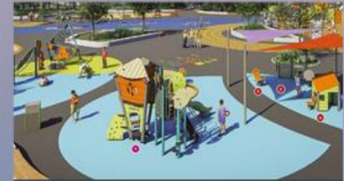
Cour de rêve Jambette

Favoriser les activités physiques en dehors de la classe